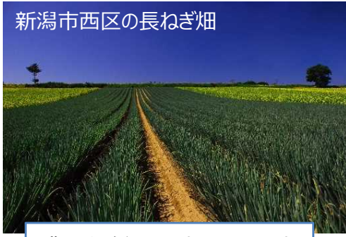
新潟市西区の長ねぎ畑